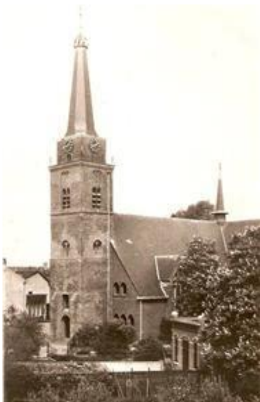
Ansichtkaart Sint Maartenskerk Hillegom

In de reeks bewerkte genealogische bronnen van de dorpen rondom Leiden, uitgegeven door de NGV-afdeling Rijnland, verscheen op 7 december alweer het 22ste deel.