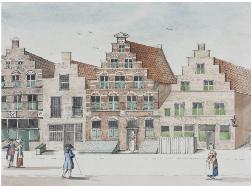
1788 'Het Roomsche Maagden- of Meisjes weeshuis op de Haarlemmerstraat te Leyden' met drie belendende percelen.