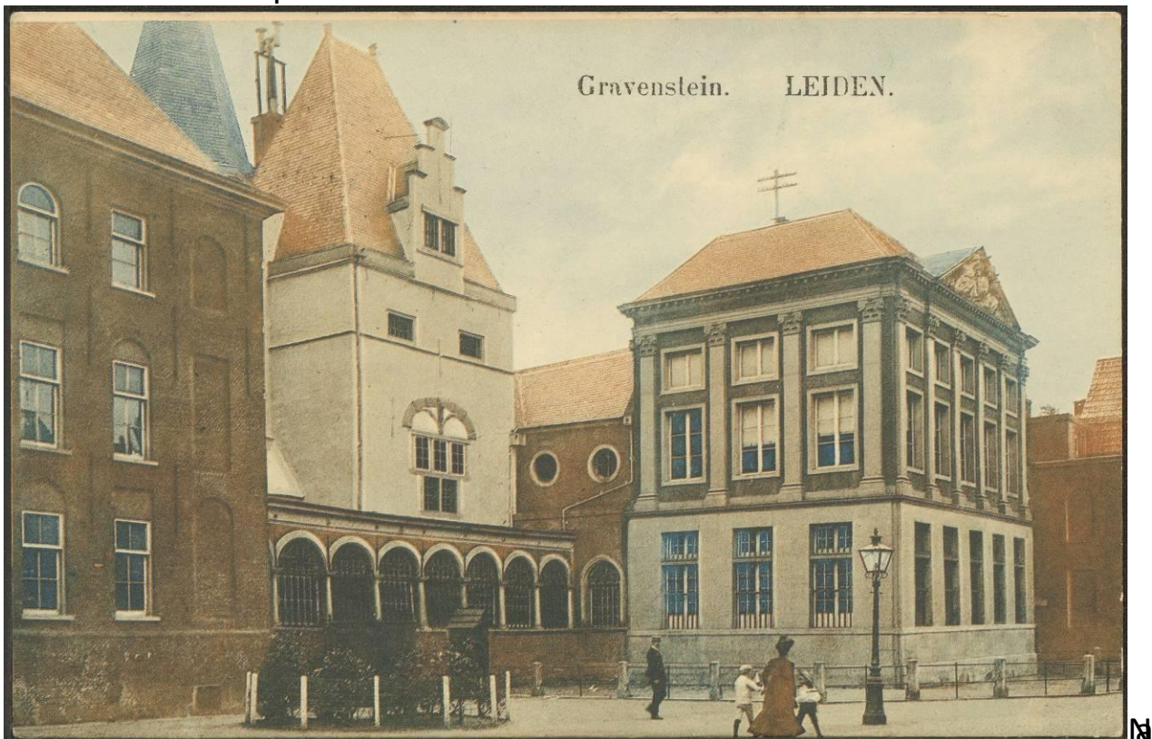
Gravenstein. Prentbriefkaart 1912 van De Tulp Haarlem.