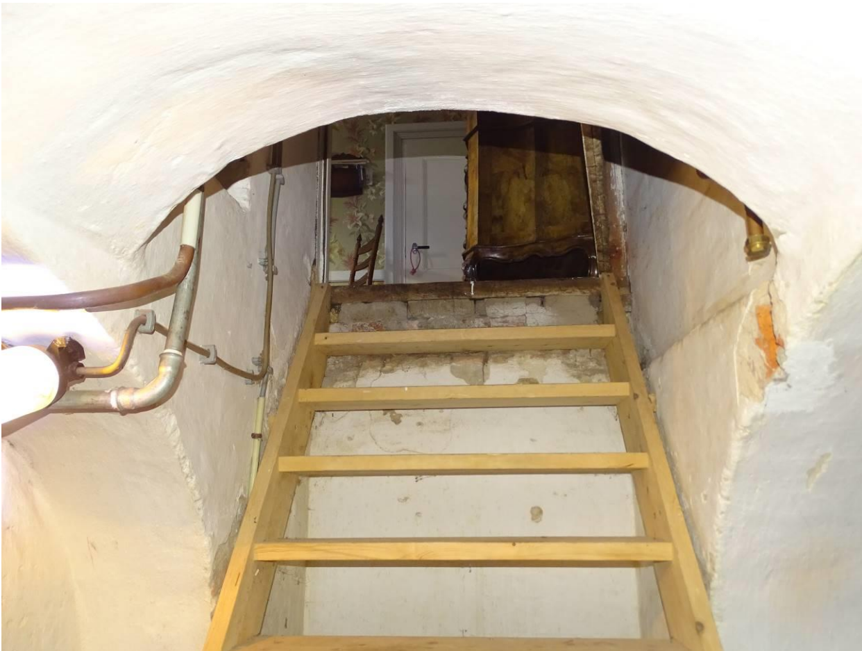
De keldertrap van boerderij 'Het Geutjen' in Doetinchem.

Vragen over de ICT-ontwikkeling leidden tot nieuwe discussies, maar ons hoofdbestuur bood met een harde toezegging perspectief op veel moois. Ik had het genoeg alvast een demo te mogen bekijken. Bij dergelijke discussies is er een deel van de vereniging die wil bezuinigen tot de laatste Gens Nostra (bij wijze van spreken!!) en anderen willen juist investeren, nieuwe leden werven, moderne media betrekken en de jeugd enthousiast maken. Ik kies voor de trap van mijn moeder. Ik sta in het rijtje van bestuursleden die pleiten voor het aansluiten bij lessen maatschappijleer om zo de jeugd te betrekken. Helpt u mee deze beweging in gang te zetten? Na de ledenvergadering las ik in de NRC dat deze krant een serie over genealogie gaat starten. Zelf ben ik met een onderzoek bezig dat genealogie verbindt met de vaderlandse- en kunstgeschiedenis. Ik probeer te achterhalen of een donkere bediende op een dubbelportret van Theodoor Netscher uit 1702 echt heeft bestaan. Zo spannend is genealogie. Wat dacht u van de politiedossiers uit de oorlogsjaren die Erfgoed Leiden op haar site heeft gepresenteerd. Agatha Christie had dit niet kunnen verzinnen. Kent u mensen die met ons mee willen doen of