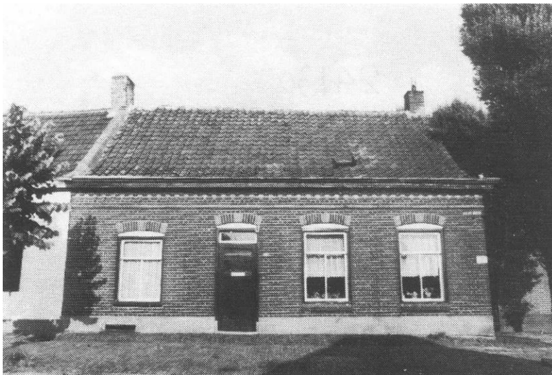
Waspik, Havendijk 2 – Beeldbank SALHA (24130)

Enige tijd geleden besloot ik op zoek te gaan naar de herkomst van 'ons' voorvaderlijk huis in Waspik, gelegen in de Langstraat en sinds 1997 onderdeel van de gemeente Waalwijk.