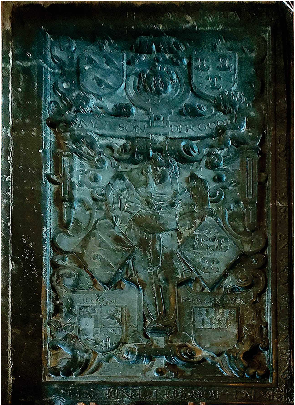
Grafsteen van de Vrouwe van Reijnsburch Stephana van Rossum