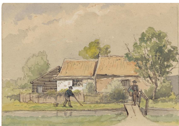
Kooilaan Leiden. Eind 19 e eeuw. Aquarel van Jan Elias Kikkert.