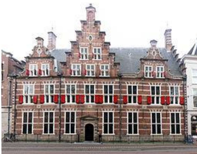
Het Gemeenlandshuis van Rijnland aan de Breestraat te Leiden