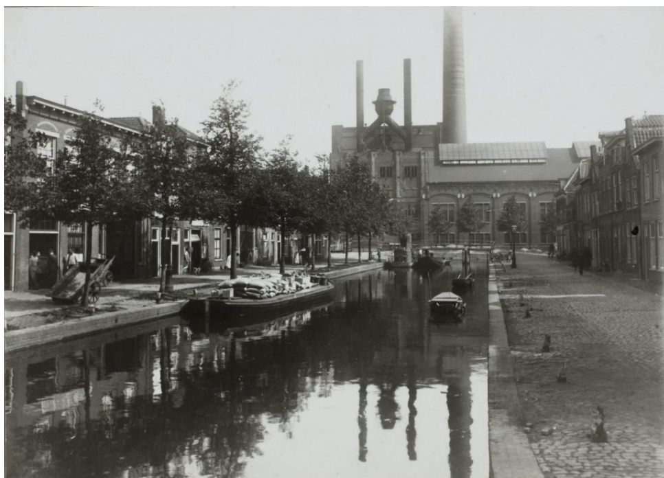
Volmolengracht begin 20 ste eeuw gezien naar de Oude Singel.