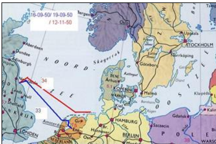
Kampen – Stockton

De laatste reis die ik in de kranten heb gevonden is die van Kampen naar Stockton.