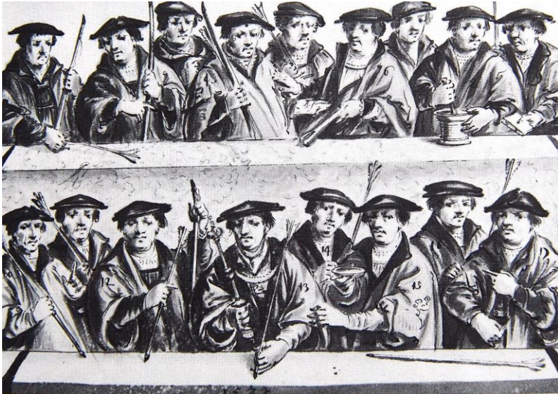
Amsterdams handbooggilde 1533

doorboord. De ridders vonden dat een slecht vooruitzicht en na hun aandringen deed de paus de voet- of kruisboog in de ban.