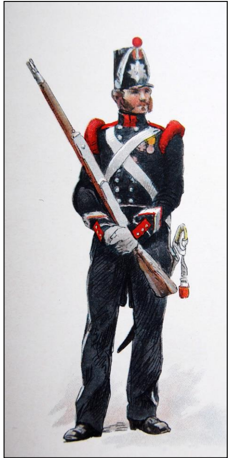
Mobiële schutterij 1831, flankeurs en fusiliers

In Rotterdam is het in 1896 een bootwerkersstaking waartegen de politie moet optreden met assistentie van de schutterij.