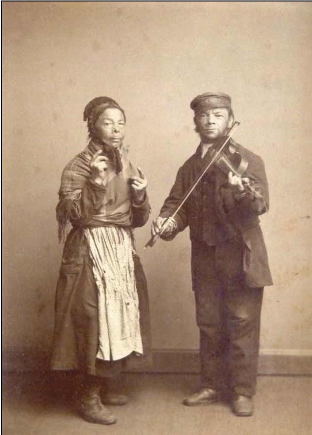
Afrikanen als muzikanten

Op 13 november 1815 schrijft Christiaan de eerste brief naar Koning Willem I waar hij vertelt over zijn leven en ziet hij zich “in armoede ziet gedompeld,” Hij vraagt om zijn baantjes als Pluimgraaf of Lantaarnaansteker terug of een pensioen. In het Noord-Hollands Archief liggen er allerlei stukken.