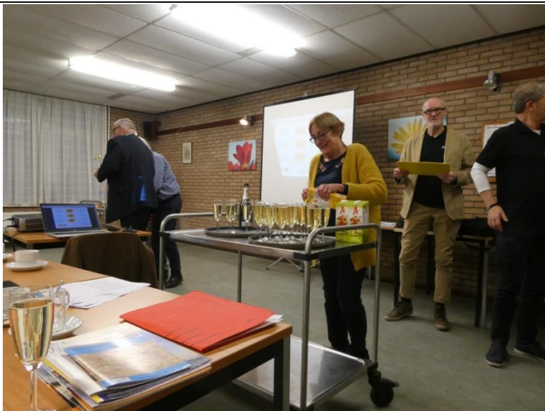
De bar juffrouw in actie