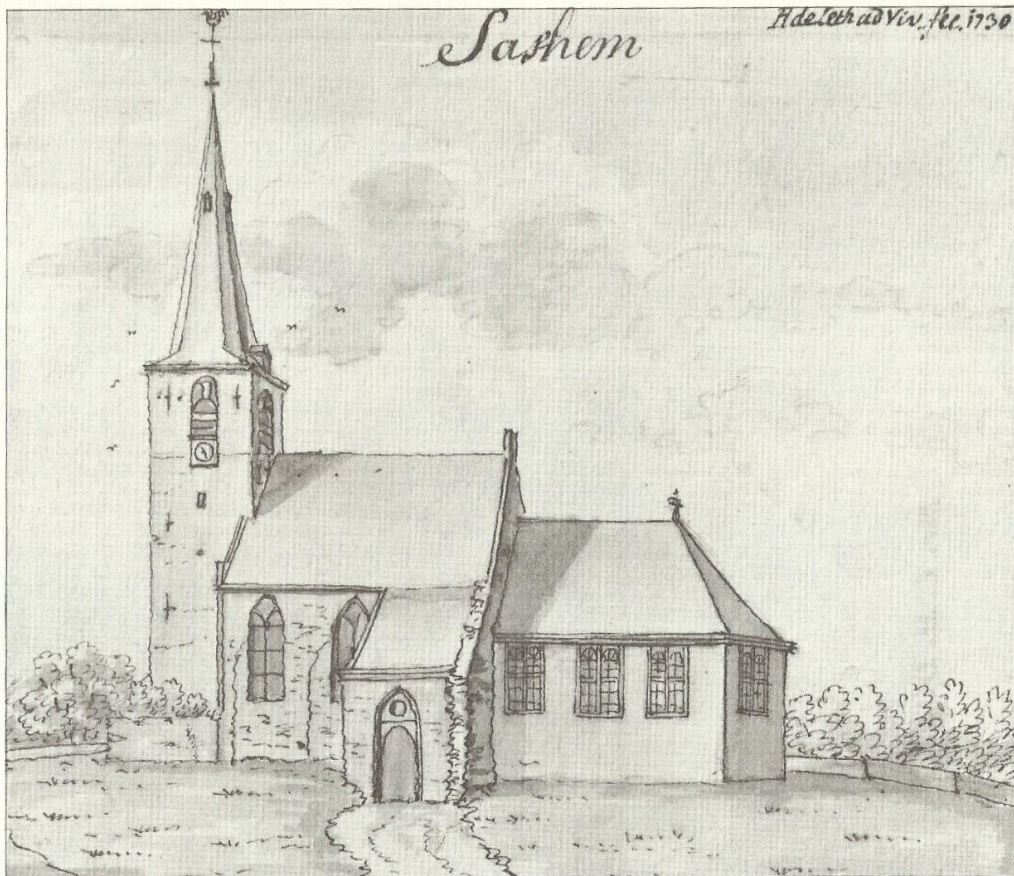
9 De kerk van "Sashem", 1730. Gewassen pentekening van H. de Leth (Amsterdam 1703 – aldaar 1766), 11 x 23½ cm, Gemeentearch. Leiden, LPV 84353.