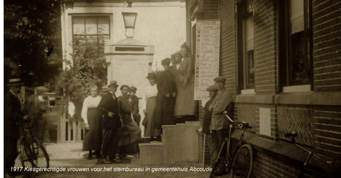
1917 Kiesgerechtigde vrouwen voor het stembureau in gemeentehuis Abcoude