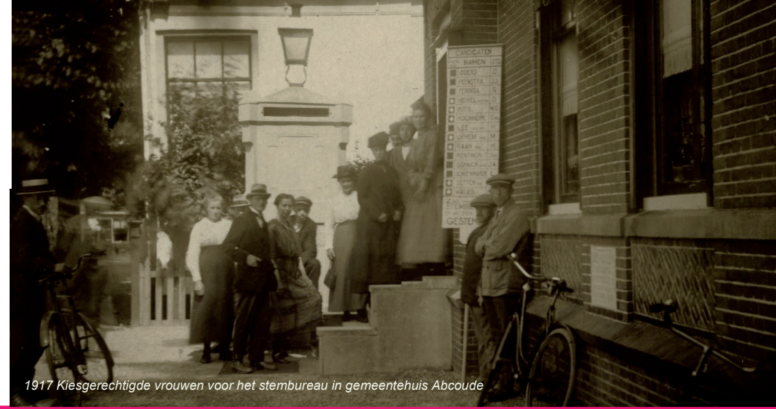
1917 Kiesgerechtigde vrouwen voor het stembureau in gemeentehuis Abcoude