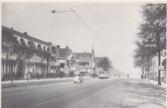
26. De Haagweg, gezien naar de richting 's-Gravenhage, in 1925. In deze jaren is de weg nog rustig. Thans is het een der drukste wegen van ons land.

waren Duitsers gelegerd die daar zelfs een varkensstal hadden, daar kom ik later op terug. Vanaf de Hoornbrug kwam een legerauto de Haagweg op en de Duitsers die er in zaten werden uitgejouwd en uitgescholden, door al de mensen die daar op de Canadezen stonden te wachten, het was een open auto. Dat de Duitsers ook in paniek waren bleek: