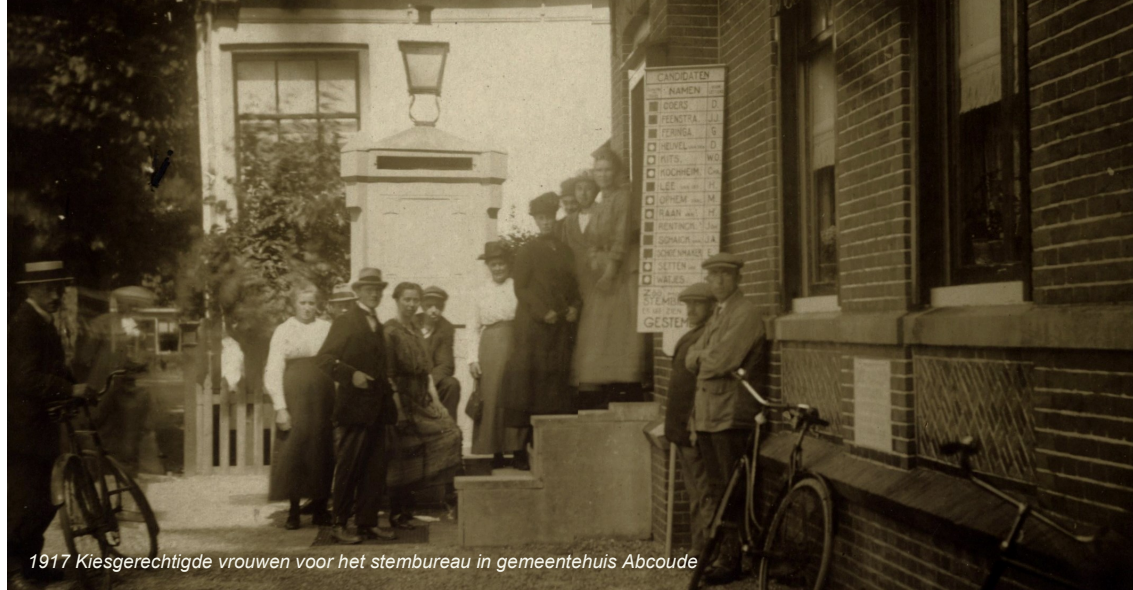
1917 Kiesgerechtigde vrouwen voor het stembureau in gemeentehuis Abcoude