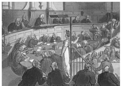
Afb. Rechtszaak in Old Baily, Londen (tekening Thomas Rowlandson, detail)