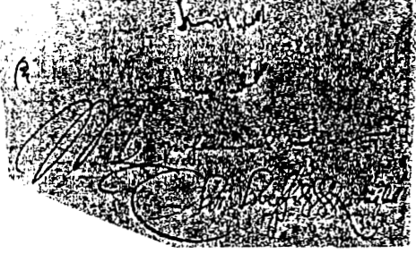
Voorbeeld van een fotografische afdruk van het origineel. (pagina 183, film 6, foto's 17 en 18)

Handwritten text at the top of the right page, appearing to be a continuation or a separate section of the document.