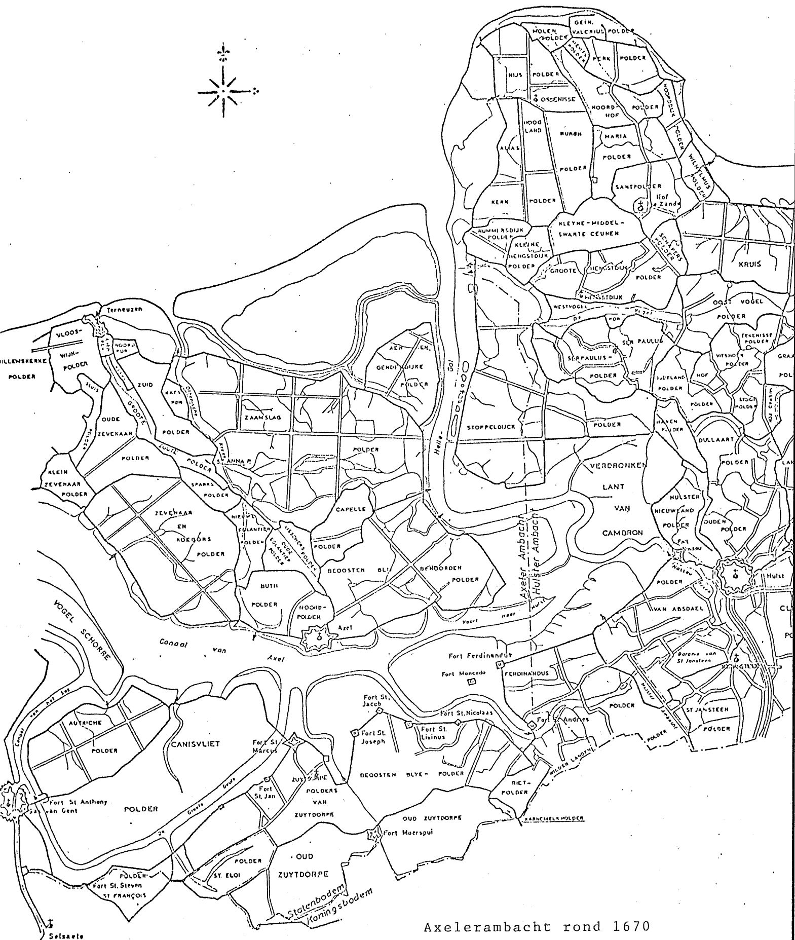
Axelerambacht rond 1670 Reconstructie door ing. K.J.J.Brand